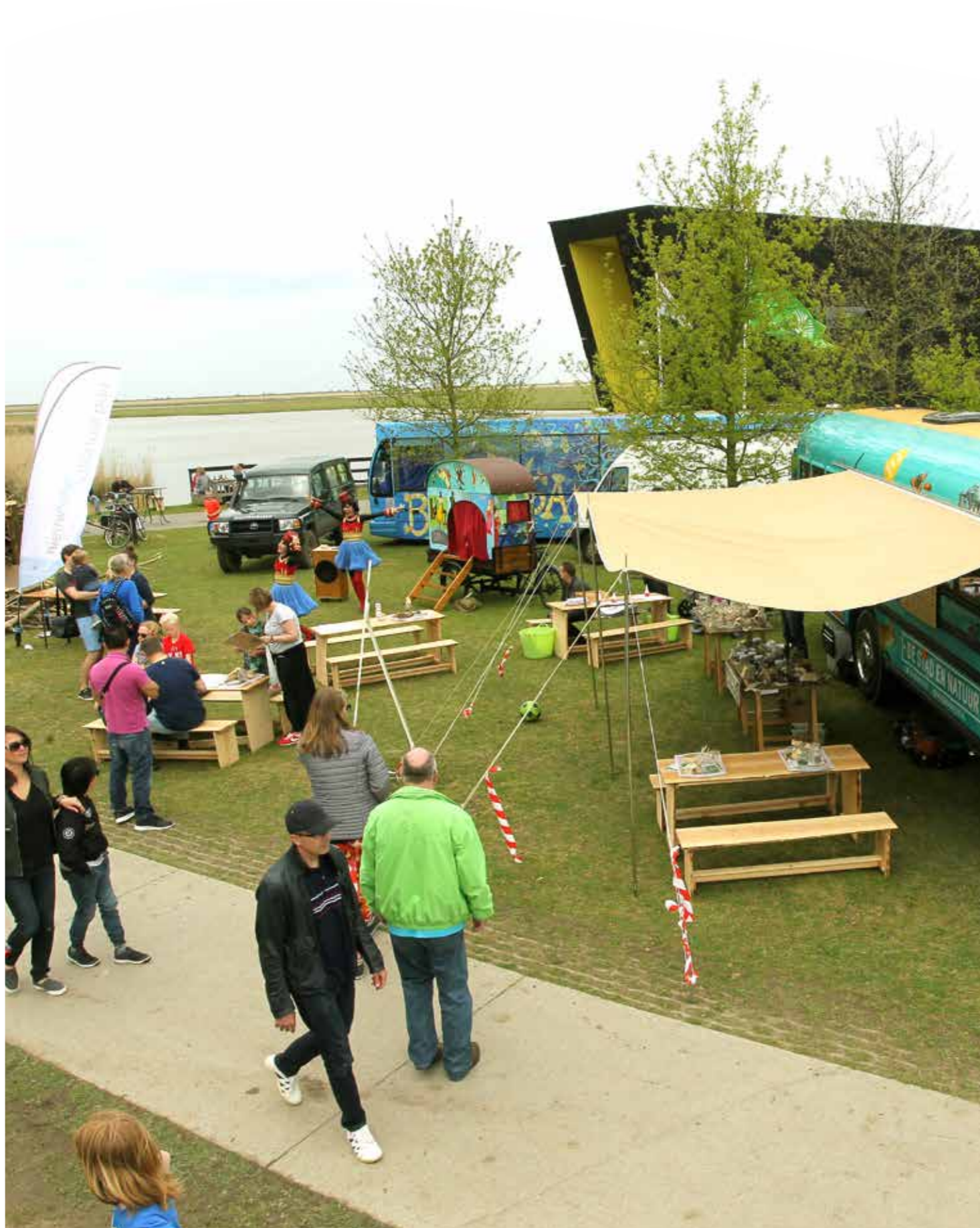
De eerste editie van Rolling Nature bij de Oostvaarders werd goed bezocht!