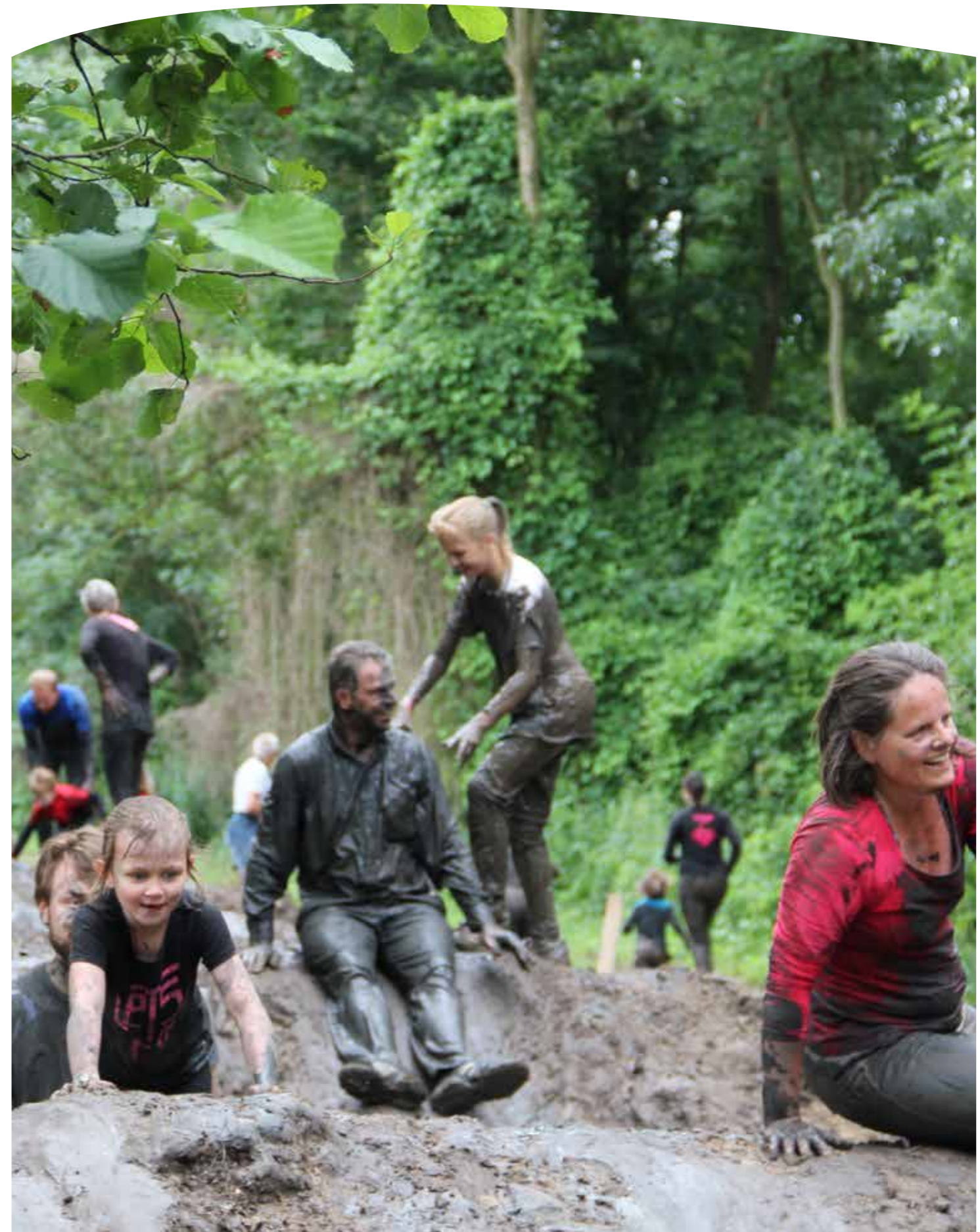
Op de uitverkochte gezinsdag van de Modderrun hadden jong en oud plezier op het modderige parcours door het bos.

Stad & Natuur op Stadslandgoed de Kempphaan was in het voorjaar en de zomer overgenomen door dino's. Aan de hand van deze beesten viel er heel wat te ontdekken in en over de natuur. In het voorjaar deden 51 klassen mee met een dinotentoonstelling en een dinospeurtocht. Na de succesvolle lessenserie werd de dinotentoonstelling opengesteld voor alle Almeerse dinofans. Zowel de tentoonstelling als de speurtocht waren een grote hit! Het ene na het andere kind kwam binnen met een grote dinobrul. Daarnaast liepen er veel kinderen rond met dino t-shirts en dinoknuffels. Elke donderdag konden de kinderen meedoen aan leuke workshops, zoals dino's knutselen, dinoklauwen gieten met gips en dinoproefjes. De workshops waren allemaal uitverkocht. Al met al zijn er meer dan 3000 bezoekers op de dinozomer af gekomen, die werd afgesloten met het dino-zomerfestival op 30 en 31 augustus. Tijdens deze twee dagen zijn er zo'n 650 bezoekers geweest die hebben deelgenomen aan verschillende workshops. Als klap op de vuurpijl konden zij rekenen op een bezoek van een bijna levensechte T-Rex. Sommigen vonden dit wel een beetje eng, maar de kinderen die op de foto durfden waren vooral erg stoer!