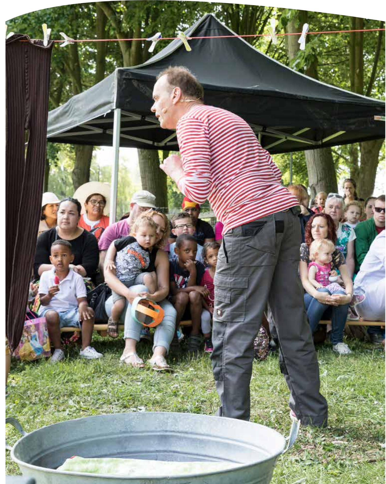
Kindertheater, een mooie vorm van laagdrempelige cultuur tijdens onze evenementen.

Een aantal jaren geleden heeft Stad & Natuur afspraken gemaakt met de gemeente Almere over het NME-programma voor Almere Poort. Hiertoe behoorde ook het aanleggen van 2 boomgaarden in Almere Poort. In 2017 heeft Stad & Natuur met een externe projectleider het initiatief genomen om een appelboomgaard te realiseren. In overleg met de gemeente is er uiteindelijk gekozen voor het Cascadepark, naast de Achillesstraat. Voorafgaand aan de plantwerkzaamheden is hierover uitvoerig gecommuniceerd met de bewoners: er werd een bewonersmiddag georganiseerd, er stond een artikel in Poort Nieuws en alle omwonenden hebben brieven in de bus gekregen. De 30 lindebomen die er al stonden zijn allemaal verplaatst binnen Almere Poort, waarna er 50 appelbomen voor teruggeplaatst zijn door Tomin. Stad & Natuur vergroent Almere Poort! De tweede boomgaard wordt in 2018 gerealiseerd aan de andere kant van het Cascadepark. Hier investeert Stad & Natuur in een bewonersinitiatief om de rozentuin om te bouwen tot een fruittuin.