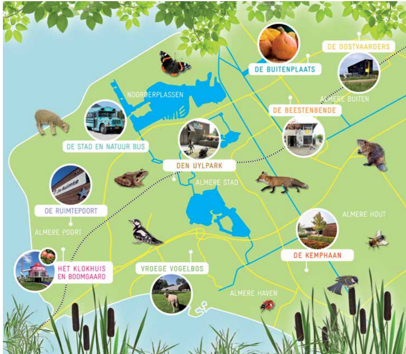
Locaties Stad & Natuur Almere