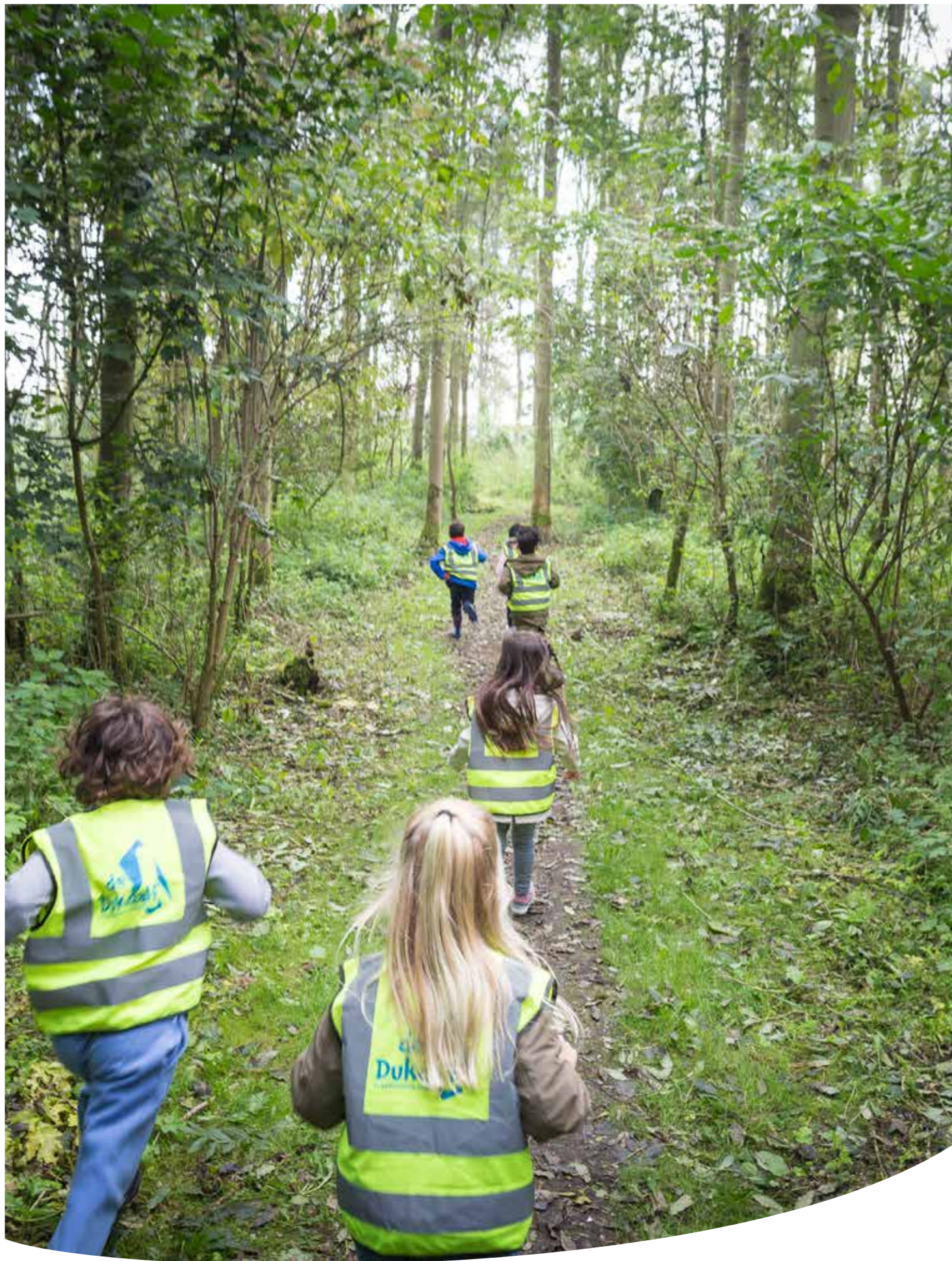
Ruim 600 kinderen hebben appels geoogst tijdens de Appeltjesles.

verwacht dat ze de bètatalenten van hun leerlingen herkennen en dat ze leerlingen kunnen enthousiasmeren voor wetenschap en technologie.