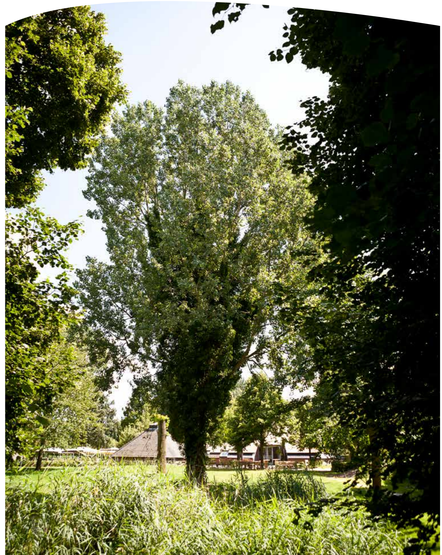
In het Vroege Vogelbos zijn veel vrijwilligers actief, ook van partnerorganisaties IVN Almere, de Almeerse Wolunie en Landschapsbeheer Flevoland.

In het voorjaar van 2017 is in Almere een cursus fruitbomen snoeien gestart. Deze cursus bestond uit een theorie- en een praktijkgedeelte en werd op zaterdag 8 april feestelijk afgesloten met een praktijkdag, waarop alle 16 deelnemers hun certificaat kregen. Landschapsbeheer Flevoland organiseerde in opdracht van Stad & Natuur Almere snoeidagen, waarbij de cursisten gezamenlijk een snoeiklus oppakten. De cursus is bedoeld voor geïnteresseerde bewoners in Almere die het snoeien van fruitbomen onder