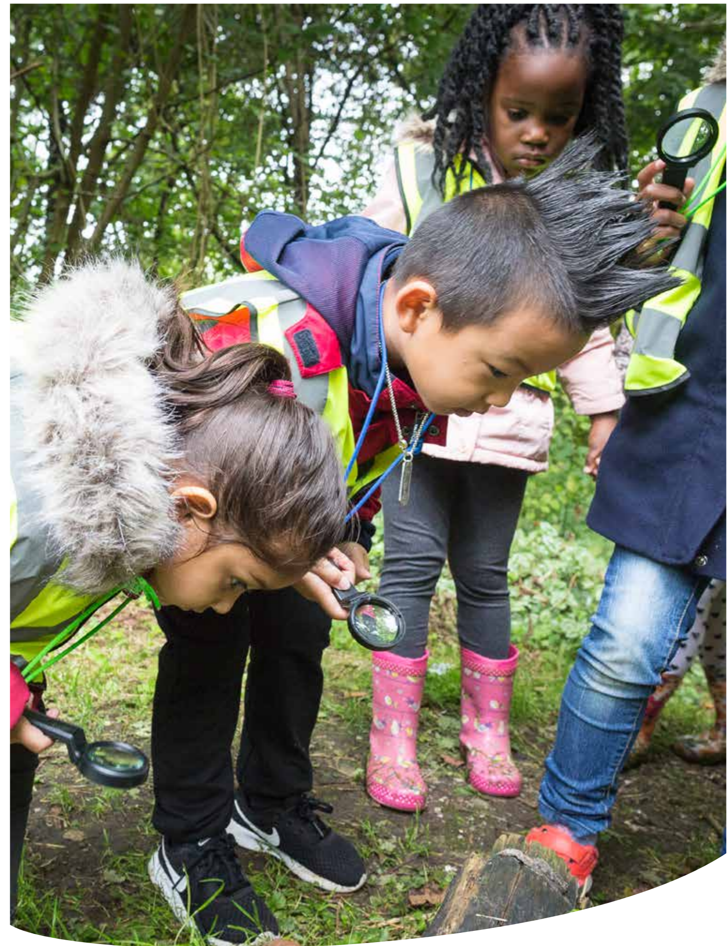
Ontwerpend en ontdekkend leren, oftewel zelf op onderzoek uit!

In november hebben we de aanbieders van onze educatieve lesactiviteiten en programma's in het kader van deskundigheidsbevordering een workshop aangeboden over onderzoekend en ontwerpend leren. Van scholen wordt namelijk verwacht dat ze in 2020 wetenschap & technologie hebben opgenomen in hun curriculum. Van leraren in het basisonderwijs wordt