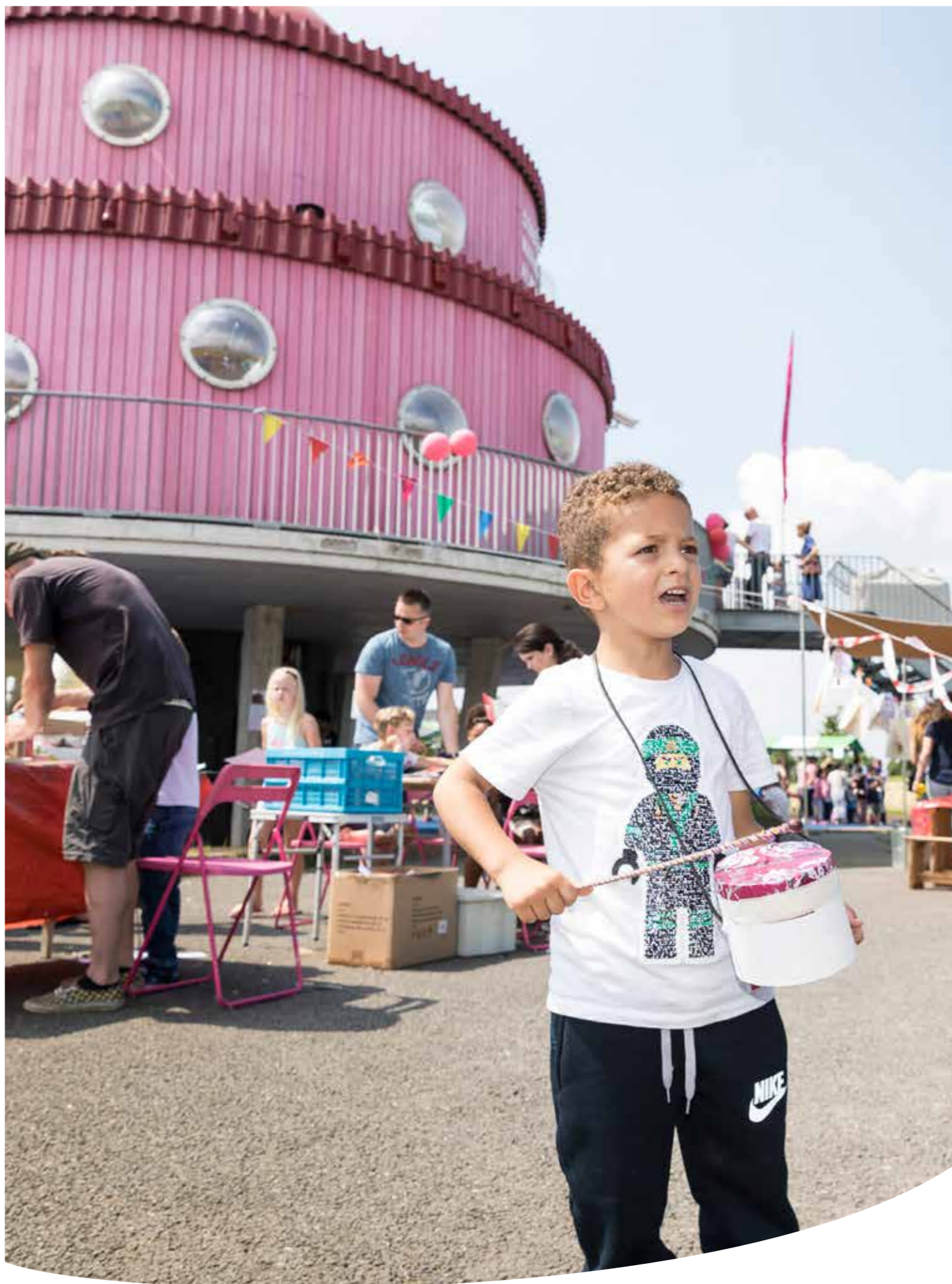
Op 21 april vond de officiële feestelijke heropening van het Klokhuis plaats.