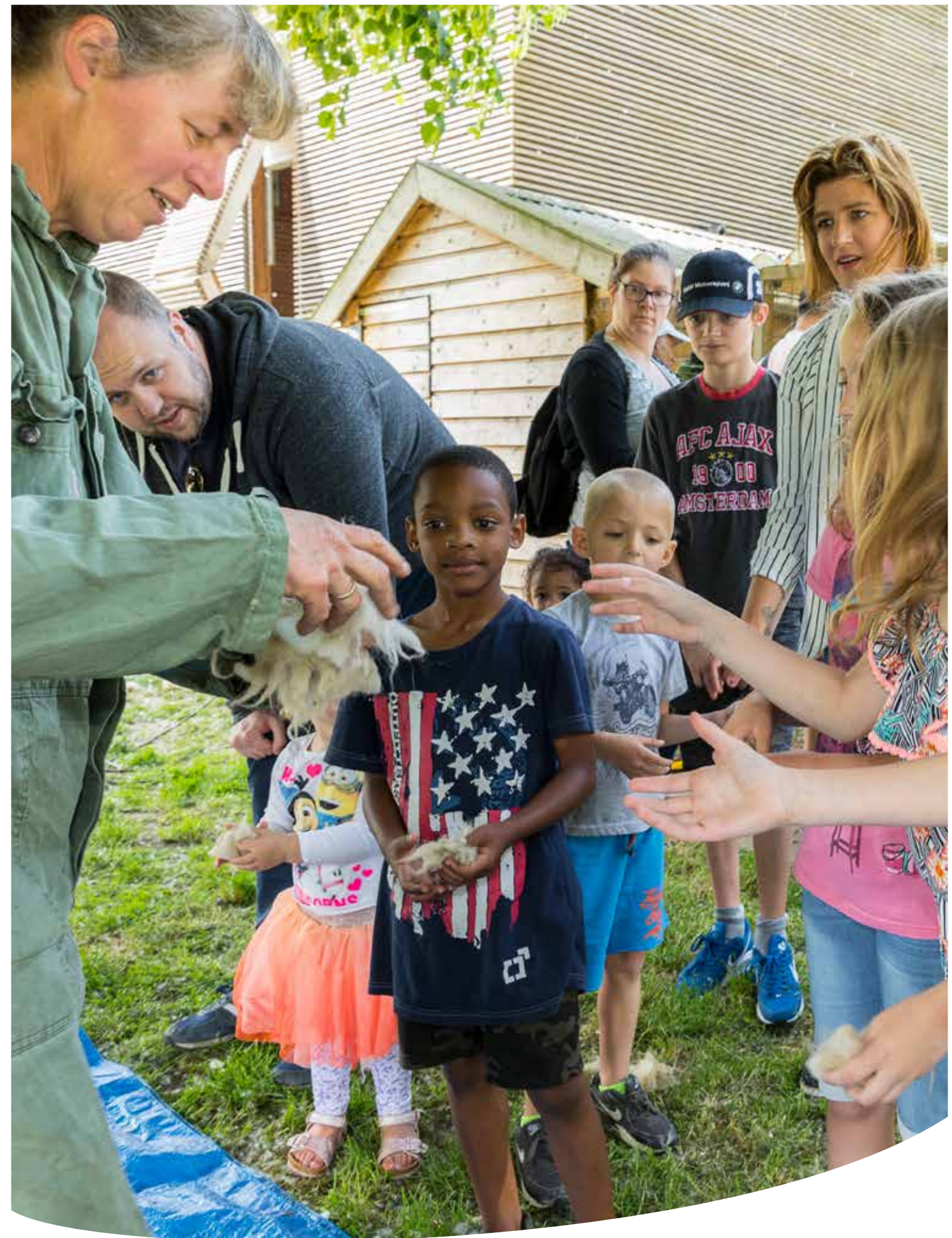
Stad & Natuur is actief op negen locaties in Almere met 15 medewerkers en vele vrijwilligers.

Al deze locaties bestieren wij met 15 medewerkers, zowel full- als partime, met ondersteuning van vele vrijwilligers. In dit jaarverslag nemen we u mee in onze werkzaamheden uit 2017.